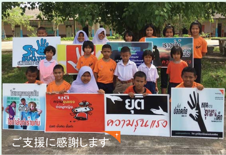
ご支援に感謝します

「子どもへの暴力防止キャンペーンを通し、自分たちの権利について多くの人と話しました。私たちは、暴力の代わりに言葉を使うよう、両親に働きかけました」