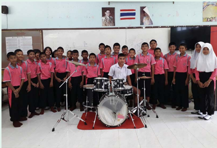
アキラくん、15歳 (左上の男の子)

「楽器の支援を受け、希望が生まれ、ぼくたちの夢を叶える助けとなりました!ぼくたちは、コンクールに出場します」