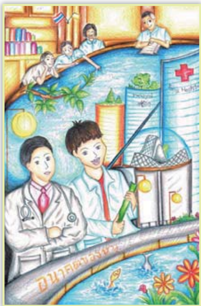
チャイルドの絵「地域で働く医師になりたい」（キッティ、17歳）