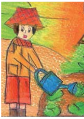
チャイルドの絵 「平和で自然が 豊かな村」 (チュアンファ ン、15歳)