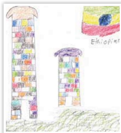
チャイルドの絵「阿克苏ムの城」 (リア、11歳)

子どもたちが安全な水源から飲料水を得ています。4基の浅井戸が建設され、合計4,200人の生徒と180世帯が安全な飲料水を得られるようになりました。