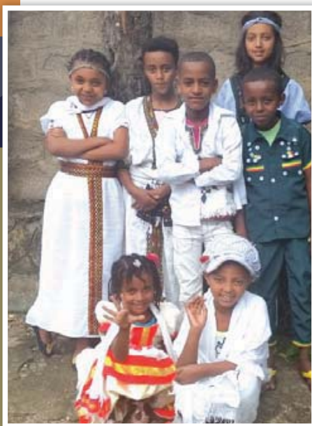
伝統的な衣服を着た子どもたち

思いやりと愛情の深い環境で暮らす子どもたちが増えています。合計32人の子どもたちが、地域で開催された「アフリカ子どもの日」の行事に参加しました。この行事では、子どもたちのニーズに焦点が当てられ、地域の発展への子どもたちの貢献の重要性が強調されました。