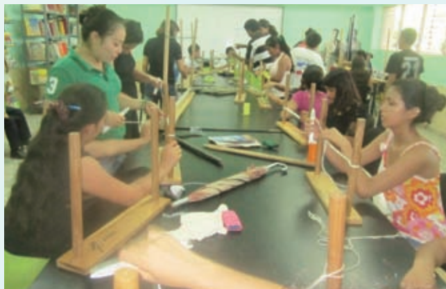
ハンモック作りの指導を受ける青少年たち