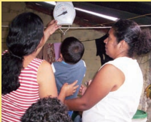
ADPの研修を受けた子育て指導員が、地域の5歳以下の子どもたちの体重を計測している様子