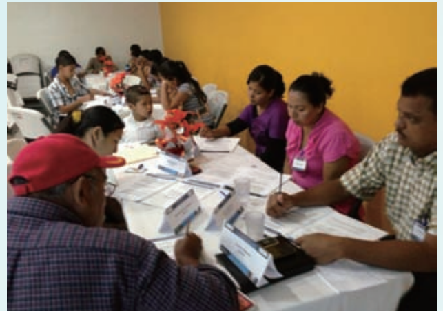
研修には市長(写真右端の男性)も参加し、若者や地域の代表者たちとともに意見交換をしました

サンアグスティンは人口6,000人弱でそれほど大きな市ではなく、人々も点在して暮らしています。貧困率は高く、エルサルバドルの基準によると、サンアグスティン地域の約66%が貧困層(うち約47%は極貧層)とみなされます。「マチスモ」と呼ばれるラテンアメリカ特有の男性優位の文化が根底にあり、特に女性が言動において全面に出ていく機会は制限されています。このような状況により、地域の目指すべき姿を示し、周りを引っ張っていくような指導者が、なかなか地域では育ちませんでした。この課題に対して、ADPは今年度「あなたが置かれた場でリーダーとなりなさい」という名の研修をワールド・ビジョンが開催し、26人の地域住民が参加しました。自己分析や自分の置かれた環境(家庭、職場、地域など)を捉え直し、その場で自分が果たすべき役割を再確認し、行動計画を立てていくという内容です。研修には若者も多く参加し、地域の開発を考える上で彼らがより積極的に発言をし、また行政関係者をはじめとする地域の大人たちも彼らの発言に耳を傾け、良いものは取り入れていくことを確認し合いました。