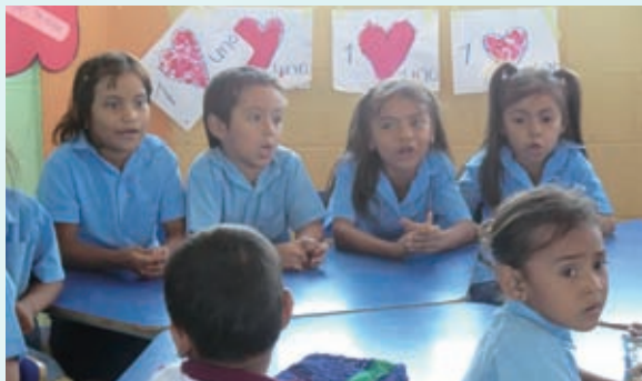
就学前教育センターで学ぶ子どもたち。小学校での生活や勉強に抵抗なく慣れるためにも、就学前教育は非常に大切です

エルサルバドルでは行政が就学前教育を公教育の一環として提供することになっているものの、現実には約55%の子どもたちにしか就学前教育が行き届いていません。これはほかのラテンアメリカ諸国の平均が、約70%であることを考えても非常に低い値です。サンアグスティン地域では、ADPにより7つの就学前教育センター(幼稚園に相当するもの)が整備され、就学前教育を受ける子どもたちの割合が、支援開始当初の53%から63%に向上してきました。この値もまだ十