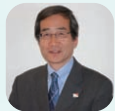
特定非営利活動法人 ワールド・ビジョン・ジャパン 常務理事・事務局長