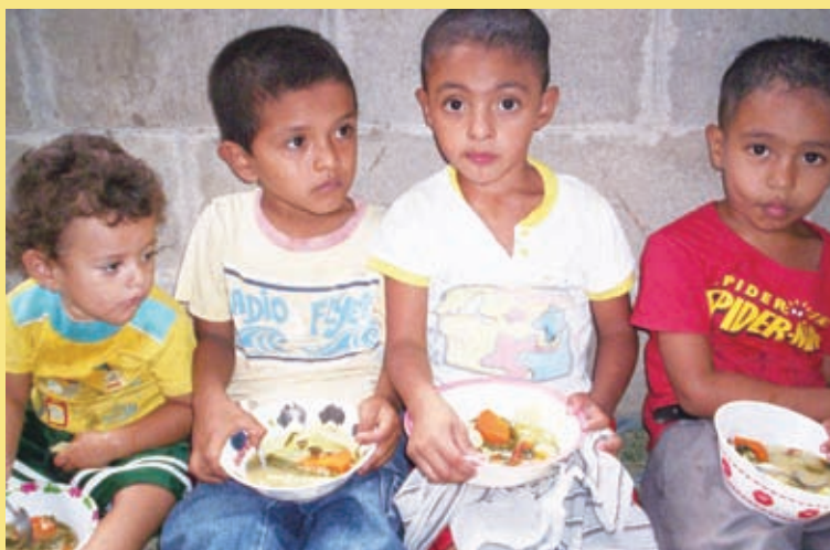
CBSNに参加し、栄養バランスのとれた食事をする子どもたち

※CBSN：Circuitos de Buena Salud y Nutrición というスペイン語名の略