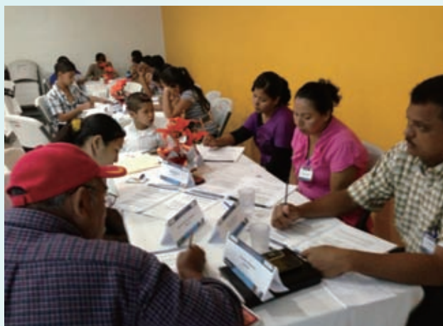
研修には市長(写真右端の男性)も参加し、若者や地域の代表者たちとともに意見交換をしました

サンアグスティンは人口6,000人弱でそれほど大きな市ではなく、人々も点在して暮らしています。貧困率は高く、エルサルバドルの基準によると、サンアグスティン地域の約66%が貧困層(うち約47%は極貧層)とみなされます。「マチスモ」と呼ばれるラテンアメリカ特有の男性優位の文化が根底にあり、特に女性が言動において全面に出ていく機会は制限されています。このような状況により、地域の目指すべき姿を示し、周りを引っ張っていくような指導者が、なかなか地域では育ちませんでした。この課題に対して、ADPは今年度「あなたが置かれた場でリーダーとなりなさい」という名の研修をワールド・ビジョンが開催し、26人の地域住民が参加しました。自己分析や自分の置かれた環境(家庭、職場、地域など)を捉え直し、その場で自分が果たすべき役割を再確認し、行動計画を立てていくという内容です。研修には若者も多く参加し、地域の開発を考える上で彼らがより積極的に発言をし、また行政関係者をはじめとする地域の大人たちも彼らの発言に耳を傾け、良いものは取り入れていくことを確認し合いました。