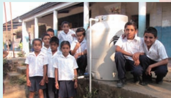
学校に備え付けられた水タンクと子どもたち

分とは言えず、引き続き就学前教育センターへの教材提供、教師への研修、親や保護者に対して教育の重要性を説く啓発活動などに力を入れていきます。