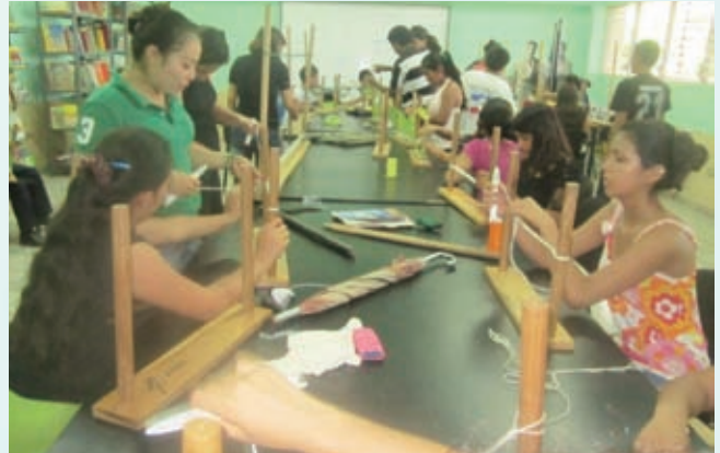
ハンモック作りの指導を受ける青少年たち