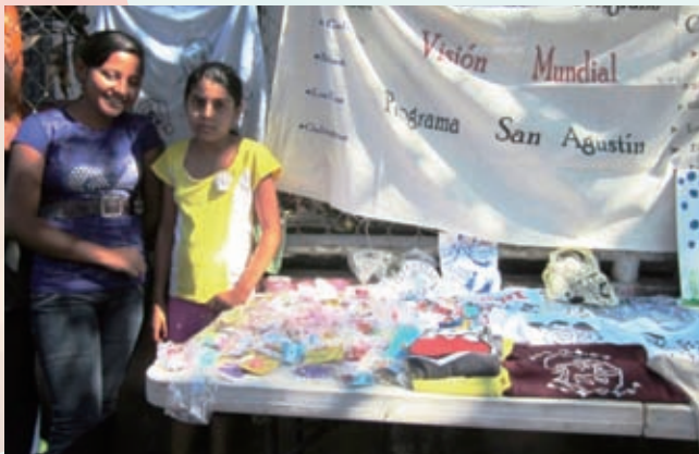
子どもクラブに参加する子どもたちが、手作りのジュエリーや織物などを展示し、地域の人々に見てもらいました

今年度も、地域の指導者、市役所、地元の警察や教会などと協力し、子どもクラブの活動を実施しました。7～12歳児向けに26のクラブ、13～20歳の青少年向けに11のクラブが結成され、それぞれ744人の子どもたちと344人の青少年が参加しています。音楽、絵画、版画、ダンス、算数、言語といった課外活動的な内容だけでなく、ハンモック作り、宝飾類(イヤリング、プレスレット、ネックレス)作り、パン作り、理容技術の指導が行われ、子どもたちの将来の仕事や生活につながるよう工夫がされています。また子どもクラブでは、地域の清掃活動やHIV/エイズ予防の内容を含む性教育も行っています。また、エルサルバドルは地震、火山活動、ハリケーン、地滑りといった自然災害が起こるため、災害時の対処方法についても教えています。