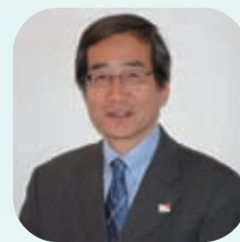
特定非営利活動法人 ワールド・ビジョン・ジャパン 常務理事・事務局長