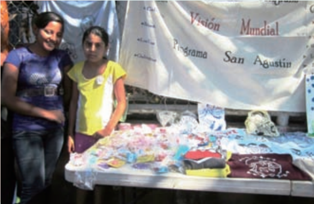
子どもクラブに参加する子どもたちが、手作りのジュエリーや織物などを展示し、地域の人々に見てもらいました

今年度も、地域の指導者、市役所、地元の警察や教会などと協力し、子どもクラブの活動を実施しました。7～12歳児向けに26のクラブ、13～20歳の青少年向けに11のクラブが結成され、それぞれ744人の子どもたちと344人の青少年が参加しています。音楽、絵画、版画、ダンス、算数、言語といった課外活動的な内容だけでなく、ハンモック作り、宝飾類(イヤリング、ブレスレット、ネックレス)作り、パン作り、理容技術の指導が行われ、子どもたちの将来の仕事や生活につながるよう工夫がされています。また子どもクラブでは、地域の清掃活動やHIV/エイズ予防の内容を含む性教育も行っています。また、エルサルバドルは地震、火山活動、ハリケーン、地滑りといった自然災害が起こるため、災害時の対処方法についても教えています。