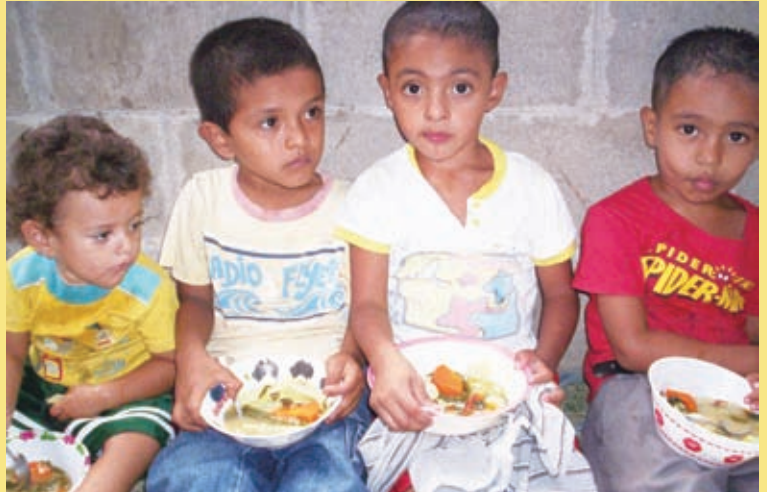
CBSNに参加し、栄養バランスのとれた食事をする子どもたち

※CBSN：Circuitos de Buena Salud y Nutrición というスペイン語名の略