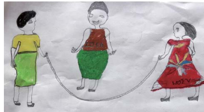
チャイルドの絵「縄跳び」 (アコル、14歳)