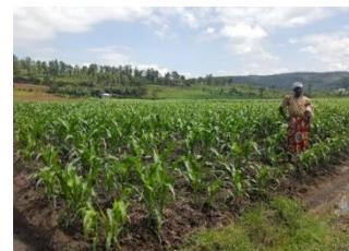
灌がいをを使ってトウモロコシを育てている様子