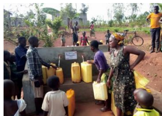
給水所には、多くの人が水をくみにきます