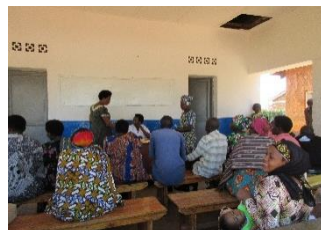
保健施設の待合スペースでは産前産後の検診を受ける人々が順番を待っています