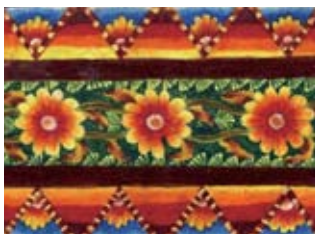
チャイルドの絵「伝統的な花の絵」(クマール、14歳)