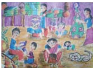
チャイルドの絵「幸せな暮らし」(ディラニ、16歳)