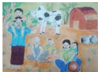
チャイルドの絵「私の家と庭」(ヴァクシャラ、15歳)